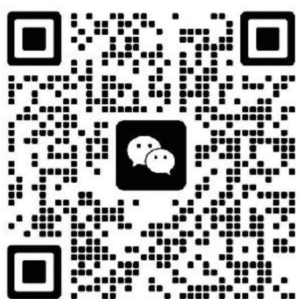
扫码添加负责人微信