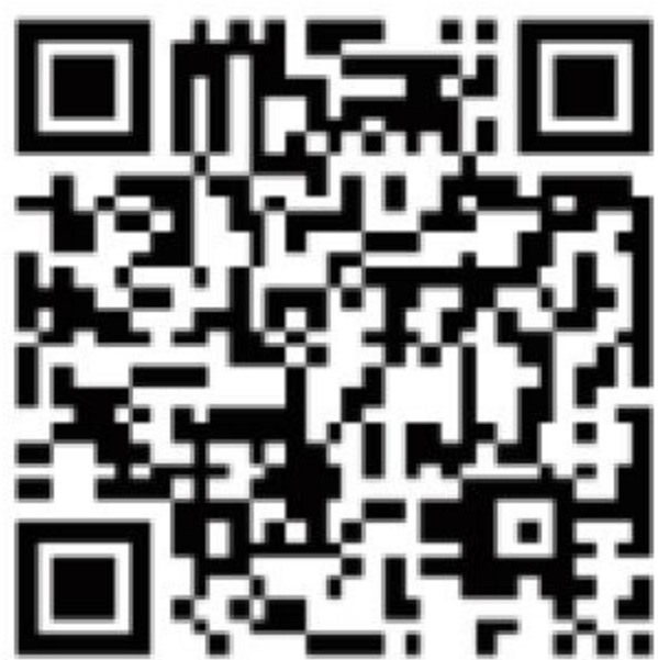
扫码填写 研究生党管中心报名表