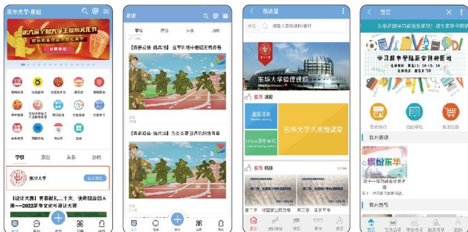
轻应用及特色活动

2. 打开手机版易班，点击主页【学校-进入溜达】，进入东华大学易班主页。点击关注“东华微课”“学习超市”等轻应用，还有丰富精彩的易班活动帖，你有大学生生活指南要查收噢~