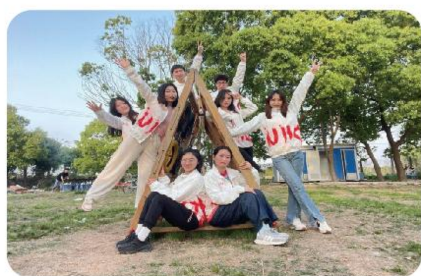
研究生党管中心团队成员

研究生党管中心坚持以“引领研究生党员思想、服务研究生党建工作、创新研究生党员教育、培育优秀研究生典型”为宗旨，下设组织部、宣传部、办公室三个部门，协同推进研究生党员“十个一”工程，努力做到教育党员有力、管理党员有力、监督党员有力、组织师生有力、宣传师生有力、凝聚师生有力、服务师生有力，扎实提升研究生党员教育管理工作质量。