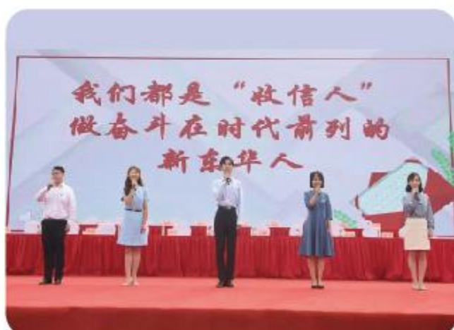
“学习进行时” 网络宣讲团