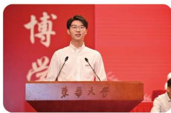
开学典礼研究生发言人风采