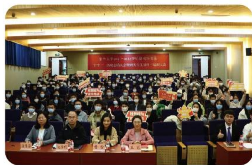
开展校级研究生党员骨干培训会