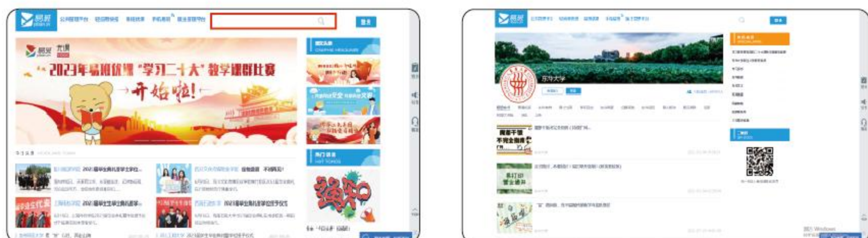
东华大学易班机构号主页

1. 打开网页版易班，在顶部“搜索”按钮输入【东华大学】，点击“搜索”，即可进入东华大学易班主页，探索东华易班！