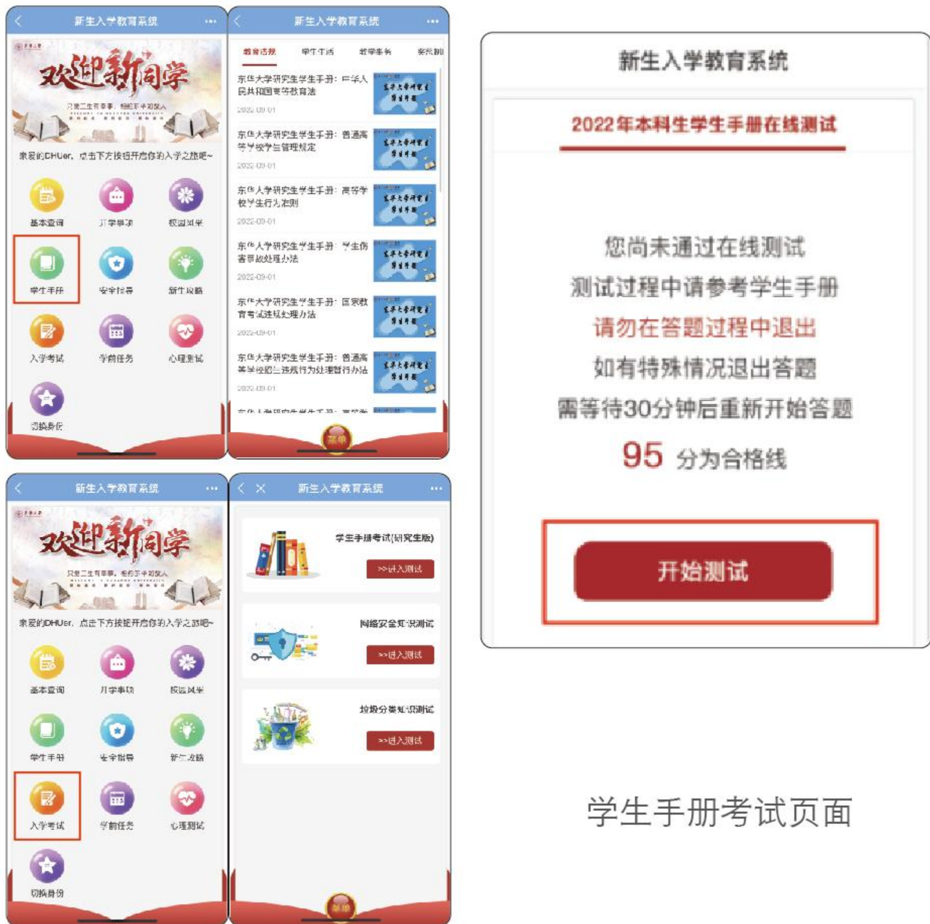
学生手册考试页面