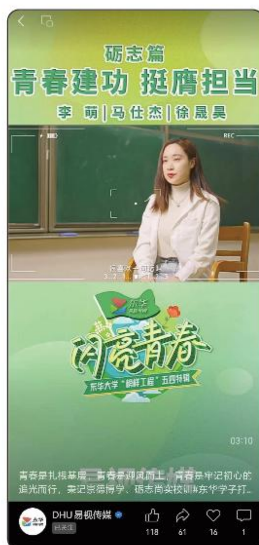
“DHU易视传媒”微信公众号、视频号