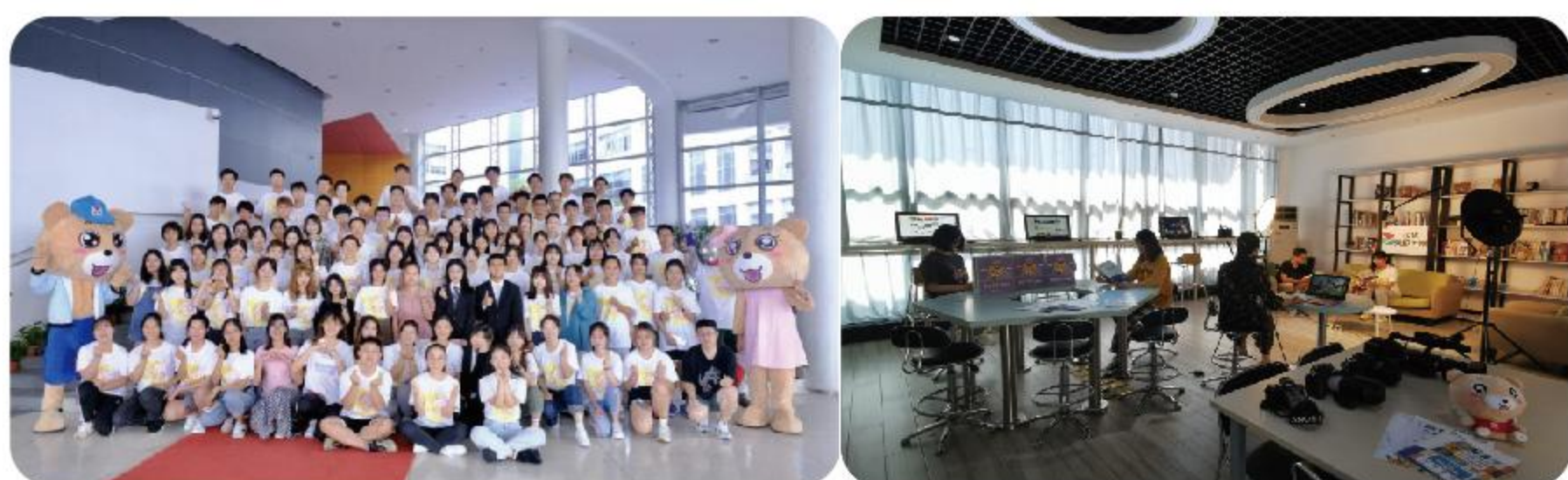
东华大学易视传媒中心

东华大学易视传媒中心，是下设4个中心、7个部门，拥有100余名骨干的校级学生团队。其中，松江校区开辟有100余平米的网络示范中心，延安路校区设有40余平米的网络服务办公室。