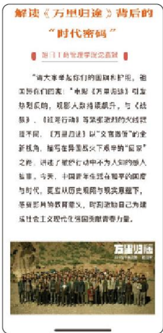
“梦想的声音” 辅导员博文专栏

2. “学习进行时” 网络宣讲团每年招募“小讲师”，打造红色文化“传习人”，深入校内校外、线上线下各阵地开展理论宣讲百余场，坚持“自我教育”与“朋辈育人”相结合，多名“讲师”代表学校在上海宣讲、微课等大赛中斩获荣誉。