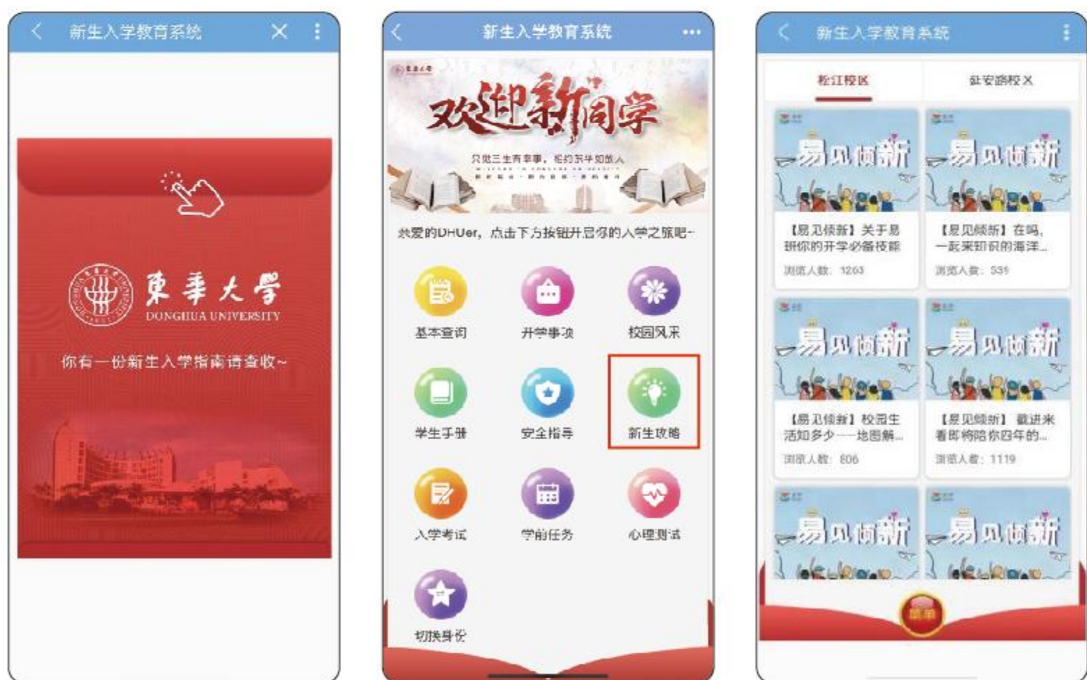
入学教育系统界面