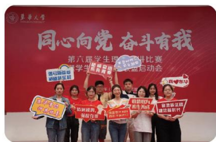
承办校级学生理论宣讲比赛