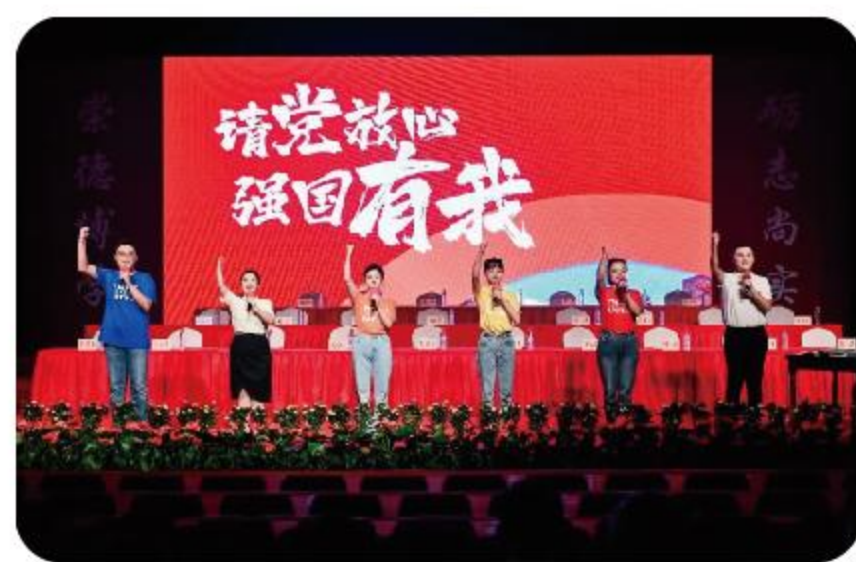
协助举办校级 新生开学典礼、毕业典礼