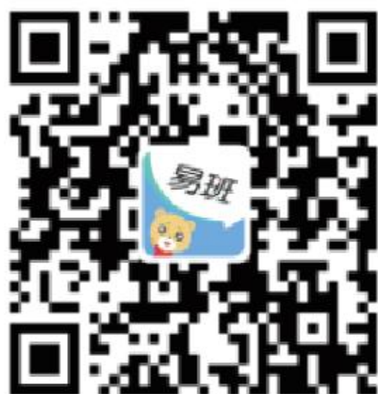
安卓系统下载二维码