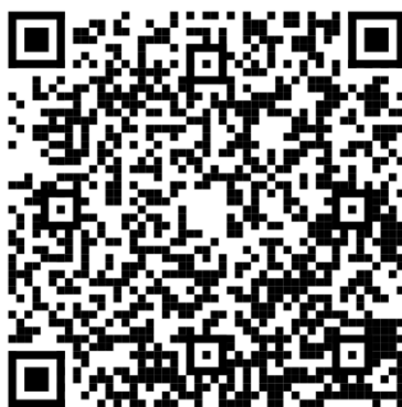
中国银行借记卡申请二维码